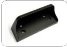
WC_HR50 Pokrywa dla czujnika HR50